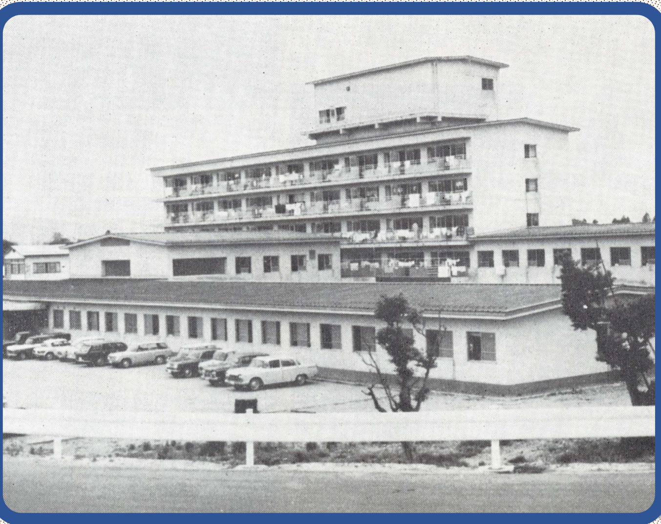
昭和40年当時の米沢市立病院